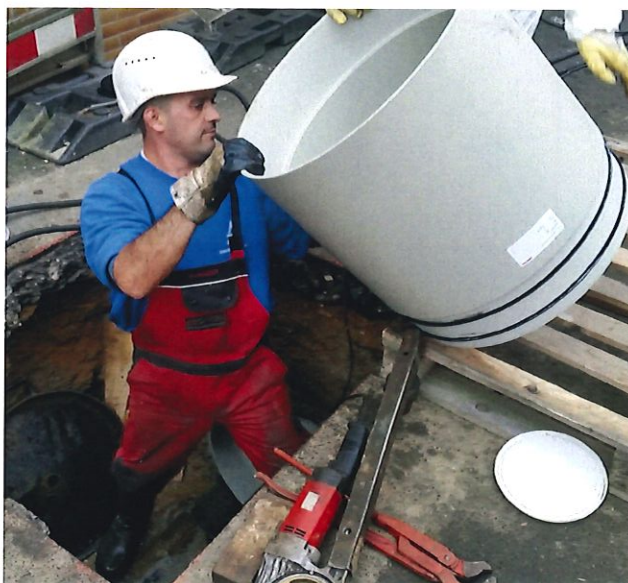
Bild 1: Montage der SIMONA® PP RM Vortriebsrohre durch einen Mitarbeiter der Firma karo-san

In Wiesbaden erfolgte die grabenlose Anbindung der Seitenanschlüsse DN 80 bis DN 150 mit den SIMONA®