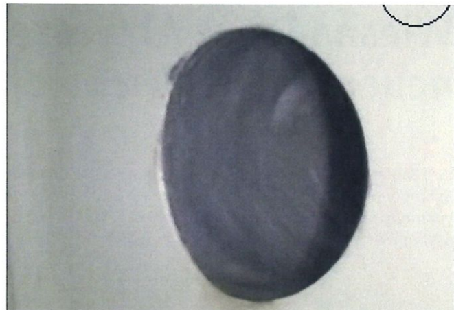
Bild 4: Erfolgreiche Anbindung durch Harzverpressung im Ausbruchbereich

PP Innensätteln mittels Harzverpressung. Dazu fräste ein Roboter die zuvor abgemessenen Positionen der Hausanschlüsse auf, deren Innenflächen durch die mechanische Bearbeitung gleichzeitig gereinigt wurden. Anschließend wurden die Innensättel bei kontinuierlicher Kameraüberwachung durch den Roboter platziert und unter permanentem Anpressdruck verschweißt. In einem zweiten Schritt wurde dann die formgebende Blase im Zulauf gesetzt und anschließend der Ausbruchbereich mit Epoxidharz verpresst.