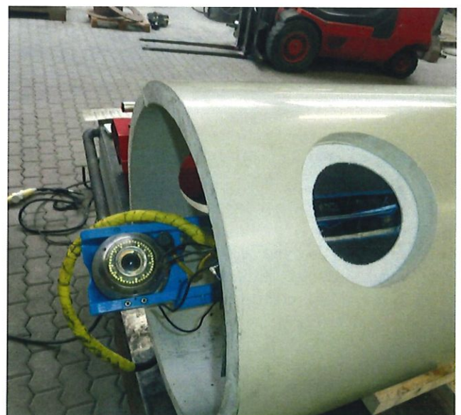
Bild 2: Schweißvorversuche beim ausführenden Auftragnehmer, Firma karo-san in Illingen